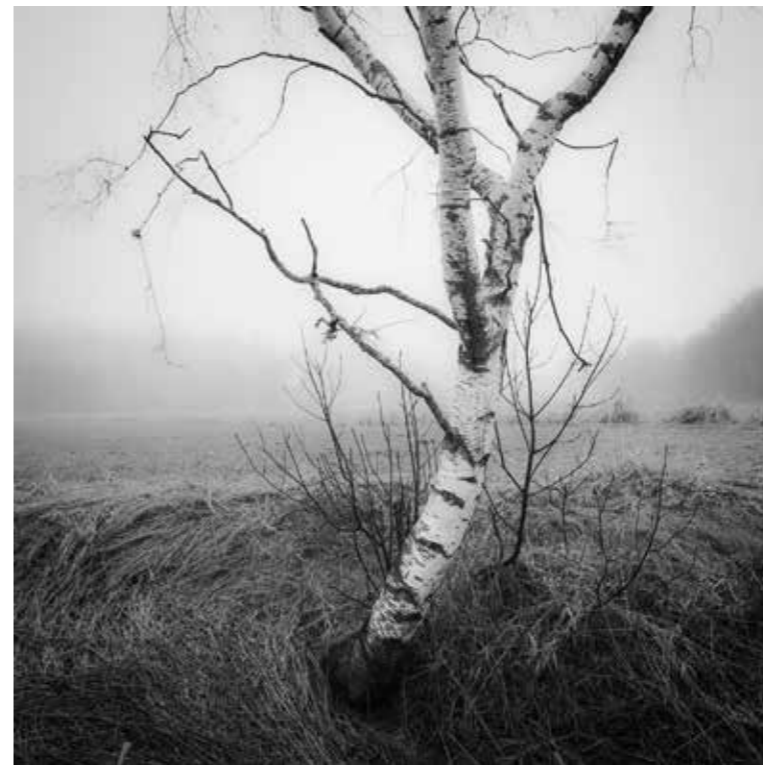
BJØRKA PÅ JORDET VED Huset