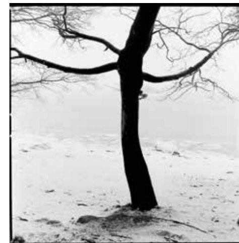
TREET PÅ FORSIDEN AV BOKA

Lista er lang over steder de har vært og presentert boka, det har vært tildels overveldende respons, noen sitter og gråter mens de hører diktene opplest og bildene vist.