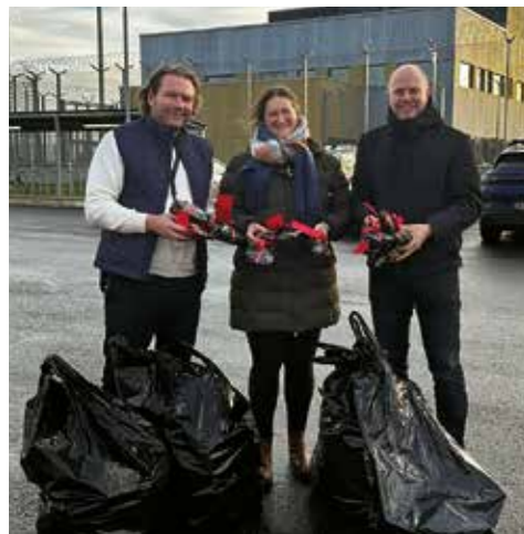
DIAKONENE I FROLAND, BARBU OG GRIMSTAD MENIGHETER OVERLEVERER STRIKKEGAVER TIL FROLAND FENGSEL JULEN 2025