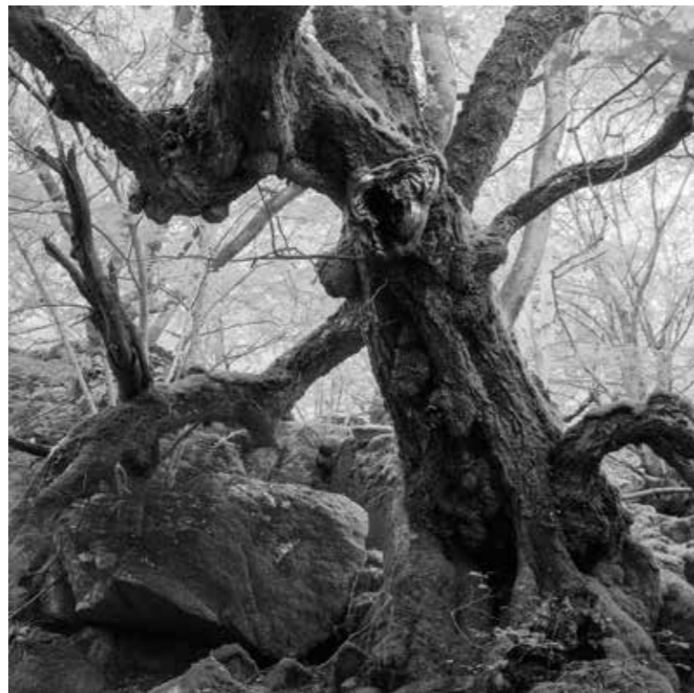
STYVINGSTRE I LISTEID NATURRESERVAT