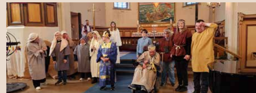
BILDER FRA GUDSTJENESTEN I 2025