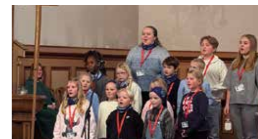
GLIMT FRA GUDSTJENESTEN 01.02: ÅRETS TÅRNAGENTER BIDRO MED DRAMATISERING OG SANG