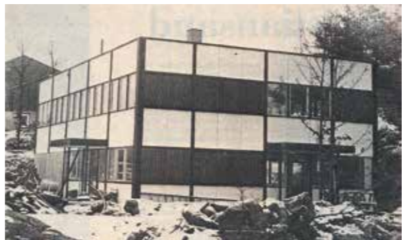
FAKSIMILE TIDEN 29.1.74

Barbufolk fra alle kanter fylte snart den