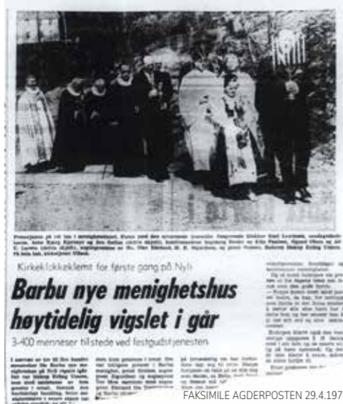
FAKSIMILE AGDERPOSTEN 29.1.1974