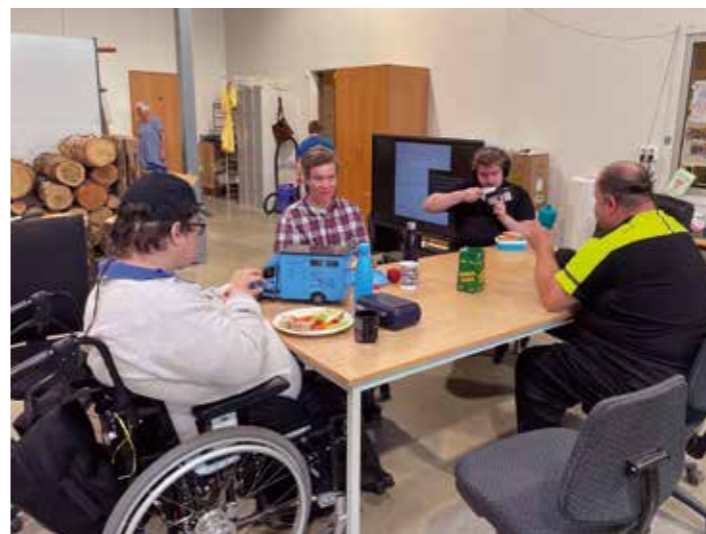
LUNSJ I HALLEN