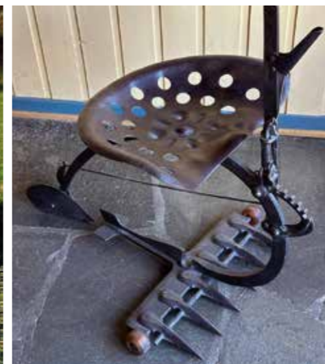
DENNE KOM TIL SISTE UTTAK I HØSTUTSTILLINGEN