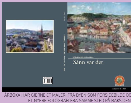
ÅRBOKA HAR GJERNE ET MALERI FRA BYEN SOM FORSIDEBILDE OG ET NYERE FOTOGRAFI FRA SAMME STED PÅ BAKSIDEN.

Onsdag 20. november lanserer vi årets Sånn var det. Hvert år siden 1995 har historielaget gitt ut denne årboka, som er å få kjøpt i bokhandlene.