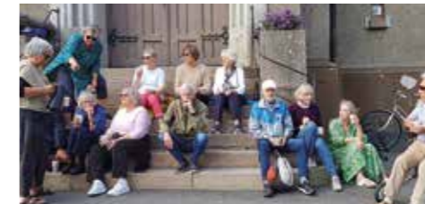
KAFFESTOPP PÅ KIRKETRAPPA

var både vær og folk med oss. Beboerne fortalte om mange av husene langs veien og i tillegg ble både Barbu kirke og Margarete-stiftelsen omtalt. Kaffe ble det denne gangen på og rundt kirketrappa med mulighet til å komme inn både i kirka og opp i tårnet etterpå.