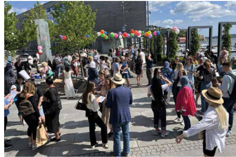
GOD STEMNING UNDER BRYGGEFESTEN SOM AVSLUTTER SKOLEÅRET HOS ARENDAL VOKSENOPPLÆRING

- Ja, det er det. Som enhetsleder i Arendal kommune har jeg ansvaret for totalvirksomheten. At vi følger lovverket,