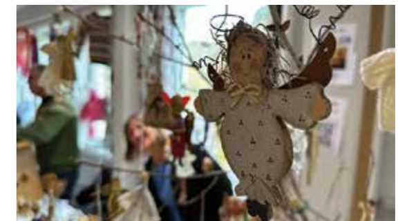
ARKIVBILDER FRA FJORÅRETS HØSTBASAR